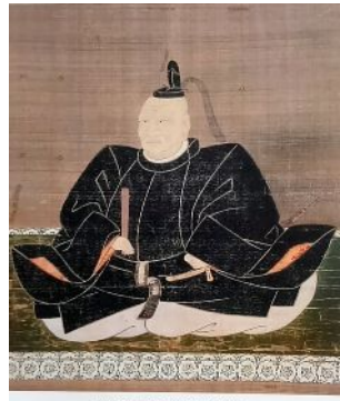
藤堂高虎公坐像 (四天王寺所蔵・部分)